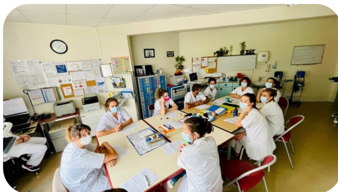
Le service d'hospitalisation : Unité de Soins Palliatifs (USP)

Le service se compose de 14 chambres individuelles. L'équipe médicale et paramédicale sont présentes dès votre arrivée et vous propose une visite du service. Le patient et ses proches sont accompagnés tout au long de l'hospitalisation. Le rythme du patient est respecté. Au décours de l'hospitalisation peuvent s'organiser des permissions. Les animaux de compagnie sont autorisés après validation de la demande.